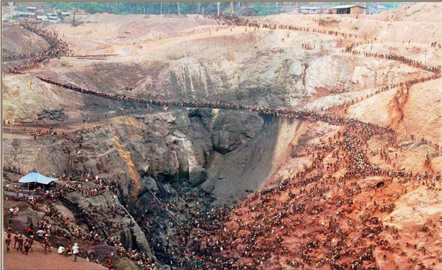
Serra Pelada garimpo. The largest South American gold rush. Bernadelli (1983)