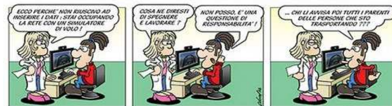
Vignette realizzate da Gian Luca Bozzoli