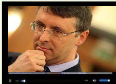
Video "Asimmetria informativa"